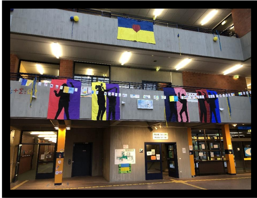
Abbildung 1 Hangung in der Eingangshalle