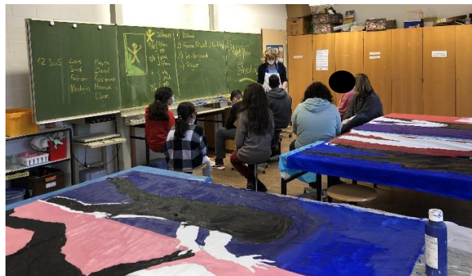
Abbildung 9: Nachbesprechung – Titelfindung für Kunstwerk

Jetzt freuen sich alle auf die Eröffnung der Kunstausstellung im Sinneswald und warten gespannt darauf, wo und wie das Ganze Projekt als „Happy Shadow“ im Sinneswald präsentiert wird.