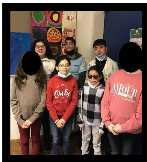
Abbildung 2 Gruppenfoto der Kunstler*innen-Gruppe

Durch die weiterhin „Corona-bedingte“-Situation, entschied man sich fur die Durchfuhrung mit einer mehr oder weniger festen Gruppe. So nahmen insgesamt 5 Schuler*innen der Klassen 5, sowie zwei Schulerinnen der Klasse 4 an dem Kunstprojekt teil.