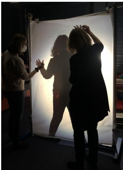
Abbildung 7: Schatten-Skizzen-Erstellung

Die Kids waren sehr konzentriert und motiviert bei der Sache und schafften es mit wenig Unterstützung innerhalb eines Tages ihre „Schatten-Tanz-Formen“ in malerischer Weise umzusetzen.