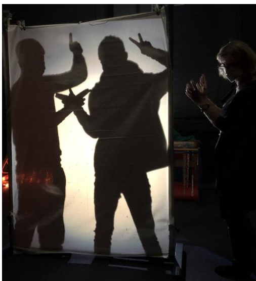
Abbildung 5: Endpose Schattentanz (Jungs)

Nach dieser „theoretischen“ Phasen ging es dann in die Planung der Bewegungs-Tanz-Formen. In dem schuleigenen Dunkelraum konnten die Schüler*innen zunächst zu selbst ausgewählten Musikliedern ausprobieren, wie man sich zu seiner Lieblingsmusik bewegen kann und dabei „Freude“ verspürt. Schnell gelang es den Schüler*innen bestimmte Bewegungsformen wiederzuerkennen und zu benennen, bei denen sie sich wohl fühlten. Daher konnte mit dem nächsten Schritt weitergemacht werden: Wie kann man diese Formen nun in Schatten darstellen und festhalten?