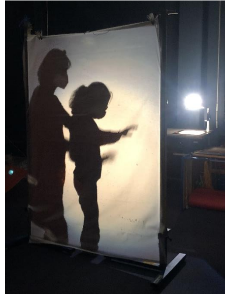
Abbildung 4: Einüben der Pose (Mädchen)

Nach dieser „theoretischen“ Phasen ging es dann in die Planung der Bewegungs-Tanz-Formen. In dem schuleigenen Dunkelraum konnten die Schüler*innen zunächst zu selbst ausgewählten Musikliedern ausprobieren, wie man sich zu seiner Lieblingsmusik bewegen kann und dabei „Freude“ verspürt. Schnell gelang es den Schüler*innen bestimmte Bewegungsformen wiederzuerkennen und zu benennen, bei denen sie sich wohl fühlten. Daher konnte mit dem nächsten Schritt weitergemacht werden: Wie kann man diese Formen nun in Schatten darstellen und festhalten?