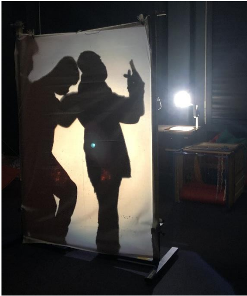
Abbildung 3: Einüben der Pose (Jungs)

Nach einem Einstieg in das Thema „Freude“ mit einem Suchsel, kamen die Schüler*innen schnell darauf, dass sie selbst mit diesem Thema Bewegung und Musik verbinden. Daraus resultierte die Idee, einen Bewegungstanz in Form von Schatten darstellen zu wollen. Diese Anonymität in Form der Schatten soll stellvertretend für Alle stehen, die auch Freude empfinden, wenn sie sich bewegen können.